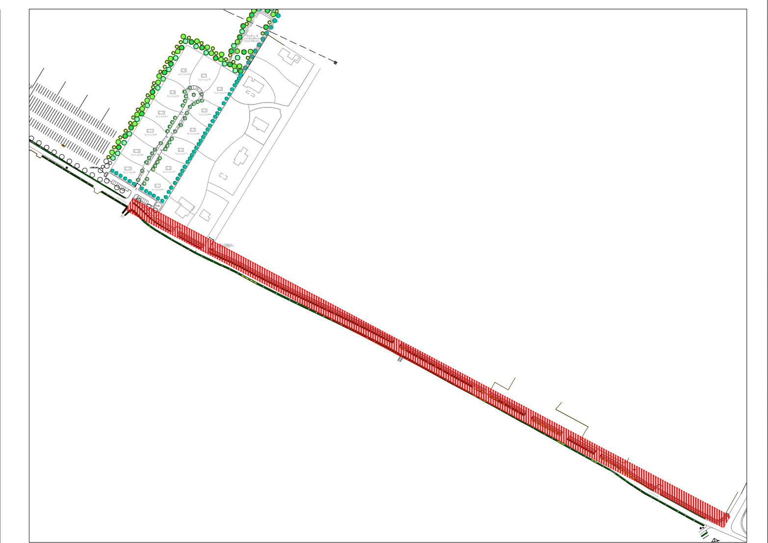
AREA DI INTERVENTO - SCALA 1:5000